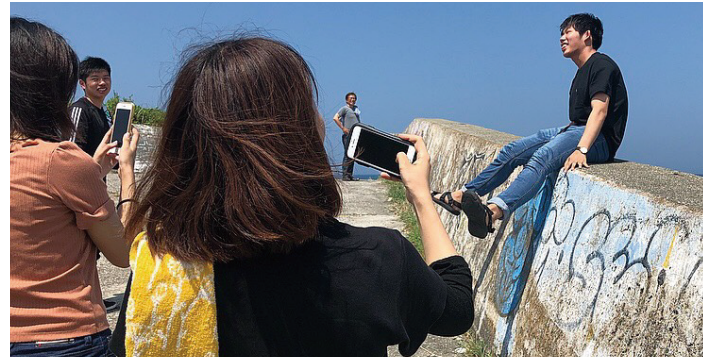
出島壁画再創造プロジェクト「TSUNAGU STREET (つなぐストリート)」：徳島文理大学総合政策学部生とともに(2019)