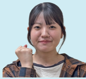
2025年度卒業生 沖縄県出身 徳島文理大学大学院進学

自分のことをよく知ってくれている先生方から引き続き指導を受けられることに魅力を感じ、大学院への進学を決めました。また、人の心に寄り添い、その人が抱える悩みや違和感について一緒に考えていきたいという思いも、進学を決めた理由の一つです。ぜひ一緒に学びましょう！