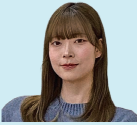
2025年度卒業生 愛媛県出身 県立高等学校 養護教諭

私自身も学校に行くことがつらい時期があったため、子どもの心に寄り添える養護教諭になりたいと考え心理学に入学しました。心理学を学ぶ中で、子どもの言動の背景を考えられるようになったと感じています。現在は、その学びを活かしながら、養護教諭として一人ひとりに向き合う日々を送っています。