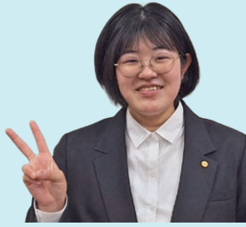
2025年度卒業生 徳島県出身 エネルギー関連企業勤務

心理学を学ぶ中で、人それぞれ違った考え方や感じ方を持っていることを理解できるようになりました。また、自分自身を客観的に見つめられるようになったと感じています。心理学は、自分らしく過ごせる学科です。そして、学んだことは日々の生活にも活かされていると感じています。