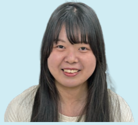
2025年度修了生 高知県出身 病院勤務 公認心理師

大学院での実習を通じて、クライアントさんの立場に立って考えることの大切さを学びました。現在は病院で、検査やケアに関わらせていただいているが、その学びを活かしながら支援方法や安心できる関わり方について日々考えています。戸惑うこともあります。やりがいを感じながら頑張っています。