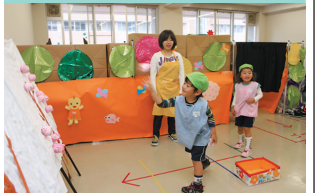
木に花を咲かせましょう

本年も大学祭において、児童学科恒例の子どもひろばを開催した。このひろばは、授業の公的実践の場であり、児童研究活動発表の場でもある。1年生から4年生、総勢150人の学生