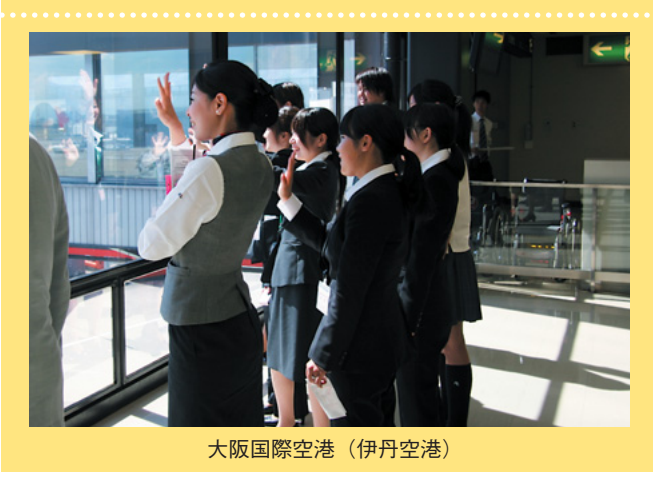
大阪国際空港(伊丹空港)

私は今夏、徳島市東消防署で、一週間消防士としての基本的な業務を体験させていただきました。 前日出動していた職員からの引き継ぎに始まり、車両点検等を行いました。通信指令室での緊急対応訓練も体験し、場所の確認等一連の対応に1分以上かかり、それを30秒でやらなければならないと聞き、大変な難しさを感じました。また