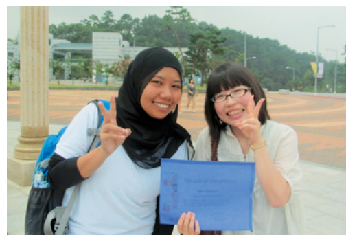
韓国夏期短期留学 一留学中にできた友人と一緒に一

まざまなことを目にし、体験できたことは今後の私に必要なことだと思いましたが。カナダへ行くにあたり、また現地でも関わった全ての人に感謝の気持ちでいっぱいでした。