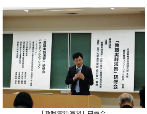
「教職実践演習」研修会