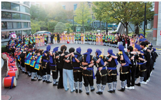
第47回山城祭は「LAUGH(笑)& PEACE(平和)」

占めており、それぞれが阿波おどりの良さ、楽しさを伝えられています。夏本番の阿波おどりは、ハーネス連の皆さんと一緒に踊らせていただきました。ハーネス連は、視覚障がいのある方とそれを支える盲導犬やボランティアの方で構成されています。夏の本番前には一緒に練習をして交流を深め、今年もさらに楽しく盛り上がった夏になりました。