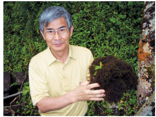
苔類ナダレヤスデゴケの採集 (タヒチ山中)