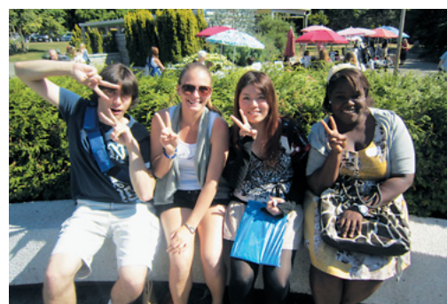
カナダ夏期短期留学 一課外活動にて一