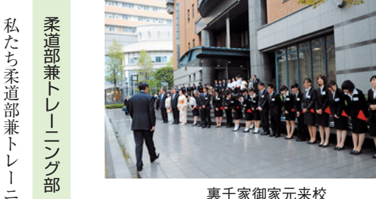
真千家御家元来校

今年度10月14日(金)から16日(日)の3日間、無事に杏樹祭を開催することができました。初日は雨が降り、2日目は不安