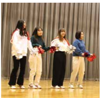
PICK UP 06 体育(ダンス)

この授業では、乳児保育がおこなわれている場の特徴と課題について理解を深めます。特に、3歳未満児の発達と適正な保育についての方法を学びます。