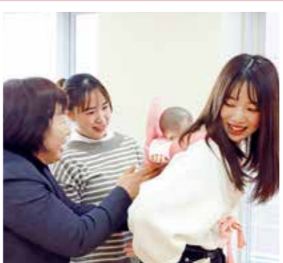
PICK UP 05 乳児保育

この授業では、乳児保育がおこなわれている場の特徴と課題について理解を深めます。特に、3歳未満児の発達と適正な保育についての方法を学びます。