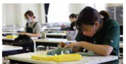
PICK UP 04 図画工作

ピアノ経験に応じたクラス分けをおこなうので、自分のペースで学べます。未経験者でも童謡などピアノの弾き歌いができるようになるカリキュラムです。卒業までには30曲程度のレパートリーを増やすことができます。