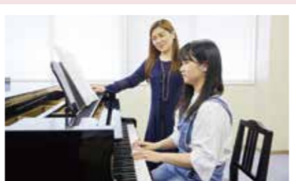
PICK UP 03 音楽Ⅰ

ピアノ経験に応じたクラス分けをおこなうので、自分のペースで学べます。未経験者でも童謡などピアノの弾き歌いができるようになるカリキュラムです。卒業までには30曲程度のレパートリーを増やすことができます。