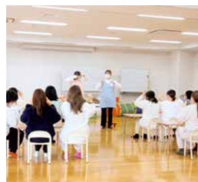
PICK UP 08 保育・教職実践演習(幼)

これまで学んできた内容と子どもの姿・保育事例を結びつけながら、多様化する保育ニーズについて学び、保育全般の理解を深めます。