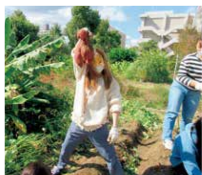
PICK UP 02 障害児保育Ⅰ

音楽遊びや楽器遊びなどを通して子どもの表現を豊かに育てるための知識や技術を学びます。