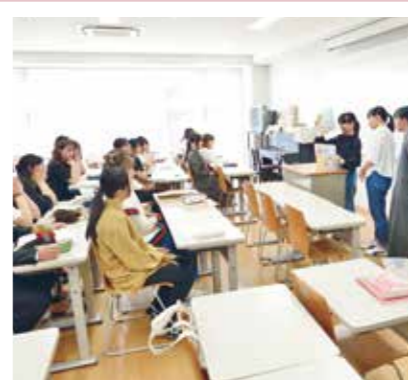
PICK UP 07 保育内容総論

グループごとに創作ダンスを作ります。授業の最終回は児童学科の学生と一緒に発表会をおこないます。