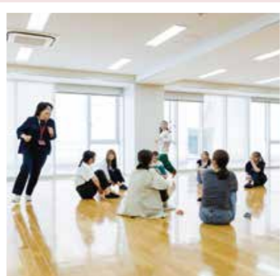
PICK UP 01 保育内容(表現)A

音楽遊びや楽器遊びなどを通して子どもの表現を豊かに育てるための知識や技術を学びます。