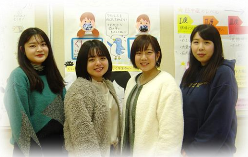
2019年度 夢をかなえた卒業生 今年度から各地の学校現場で活躍中

養護教諭採用試験の現役合格は難しいですが、本学科ではこの4年間毎年現役合格する学生が誕生しています。その強さの秘訣とは？